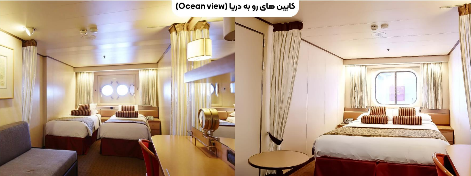
کابین‌های رو به دریا (Ocean view)

کابین‌های خارجی در طبقات ۴ و ۶ (حدوداً ۱۹ متر مربع) قرار دارند و می‌توانند تا ۴ نفر را جای دهند، با دو تخت پایین و چیدمان‌هایی شامل ۱ تخت بالا و ۱ تخت خواب تک نفره یا دو نفره بلند، حمام با وان یا دوش، تلفن، خشک‌کن هو، صندوق امانات و تلویزیون.