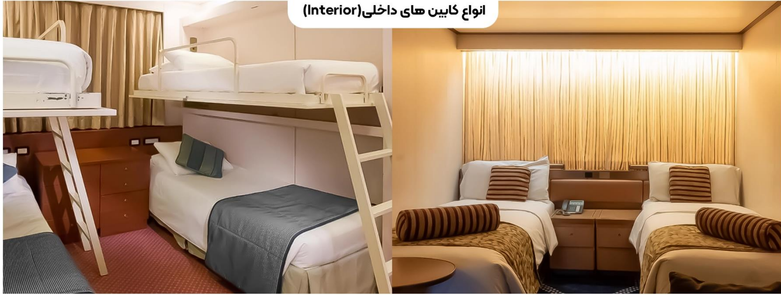
انواع کابین‌های داخلی (Interior)

کابین‌های داخلی در طبقات ۴ تا ۹ و بعضاً ۱۰ (حدوداً ۱۷ متر مربع) قرار دارند و می‌توانند تا ۴ نفر را جای دهند، با دو تخت پایین و چیدمان‌هایی شامل ۱ تخت بالا و ۱ تخت خواب تک نفره مبلی. امکانات اضافی شامل حمام با دوش، تلفن، خشک‌کن هو، صندوق امانات و تلویزیون می‌باشد. اندازه و طرح بندی ممکن است در دسته‌بندی کابین یکسان متفاوت باشد