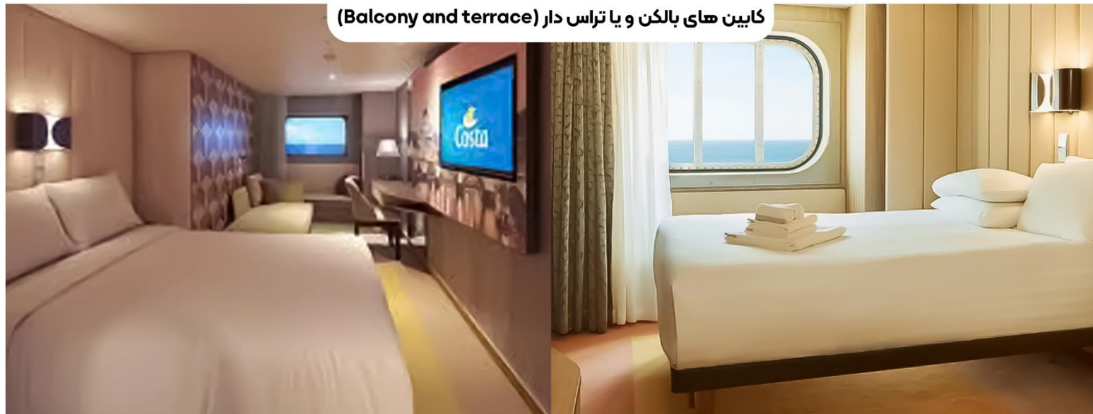
کابین های بالکن و یا تراس دار (Balcony and terrace)

در طبقات ۹ تا ۱۷، با حمام خصوصی، تا ۴ تخت، یک تخت دو نفره (یا ۲ تخت تک نفره). دو تخت جمع‌شو برای مهمانان سوم و چهارم در دسترس است، کولر گازی، تلویزیون ۴۰ اینچ، سشوار، تلفن، اتصال Wi-Fi (هزینه‌ها اعمال می‌شود)، لوازم بهداشتی، پتو و حوله‌های مورد نیاز برای اقامت (شیت‌ها و حوله‌ها)