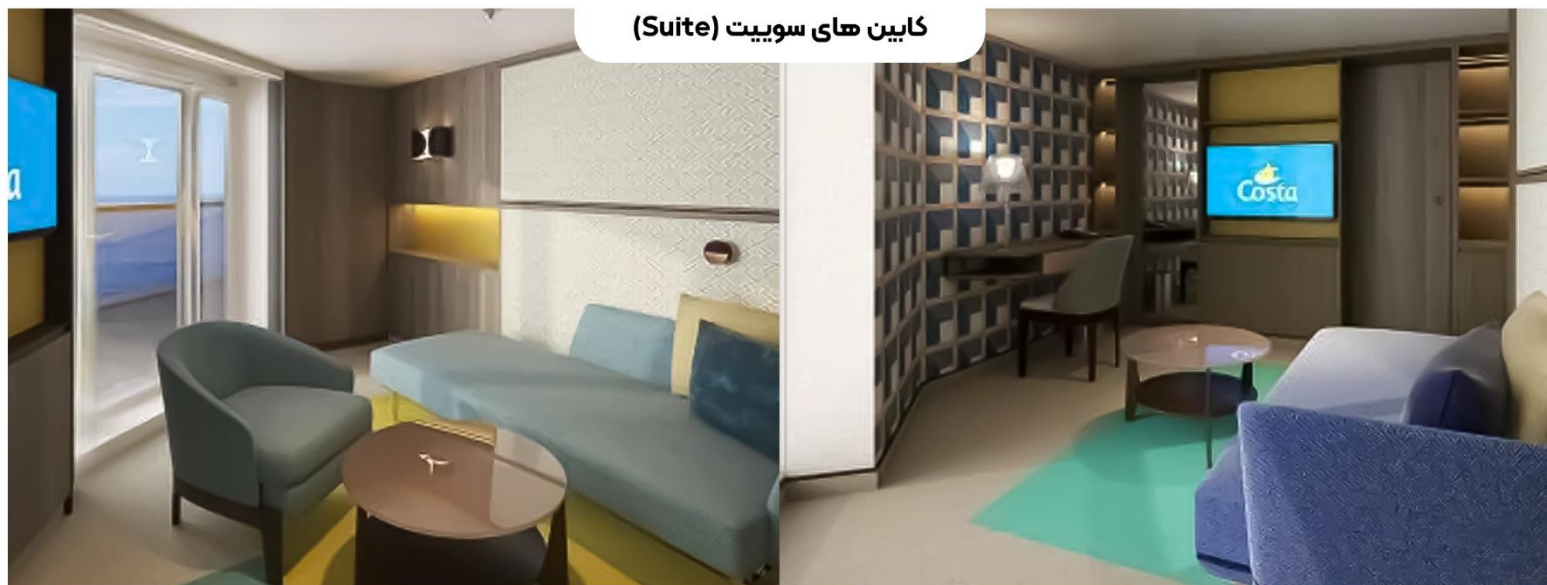
کابین های سویت (Suite)

در طبقات ۹ تا ۱۷، با حمام خصوصی، تا ۴ تخت، یک تخت دو نفره (یا ۲ تخت تک نفره). دو تخت جمع‌شو برای مهمانان سوم و چهارم در دسترس است، کولر گازی، تلویزیون ۴۰ اینچ، سشوار، تلفن، اتصال Wi-Fi (هزینه‌ها اعمال می‌شود)، لوازم بهداشتی، پتو و حوله‌های مورد نیاز برای اقامت (شیت‌ها و حوله‌ها)