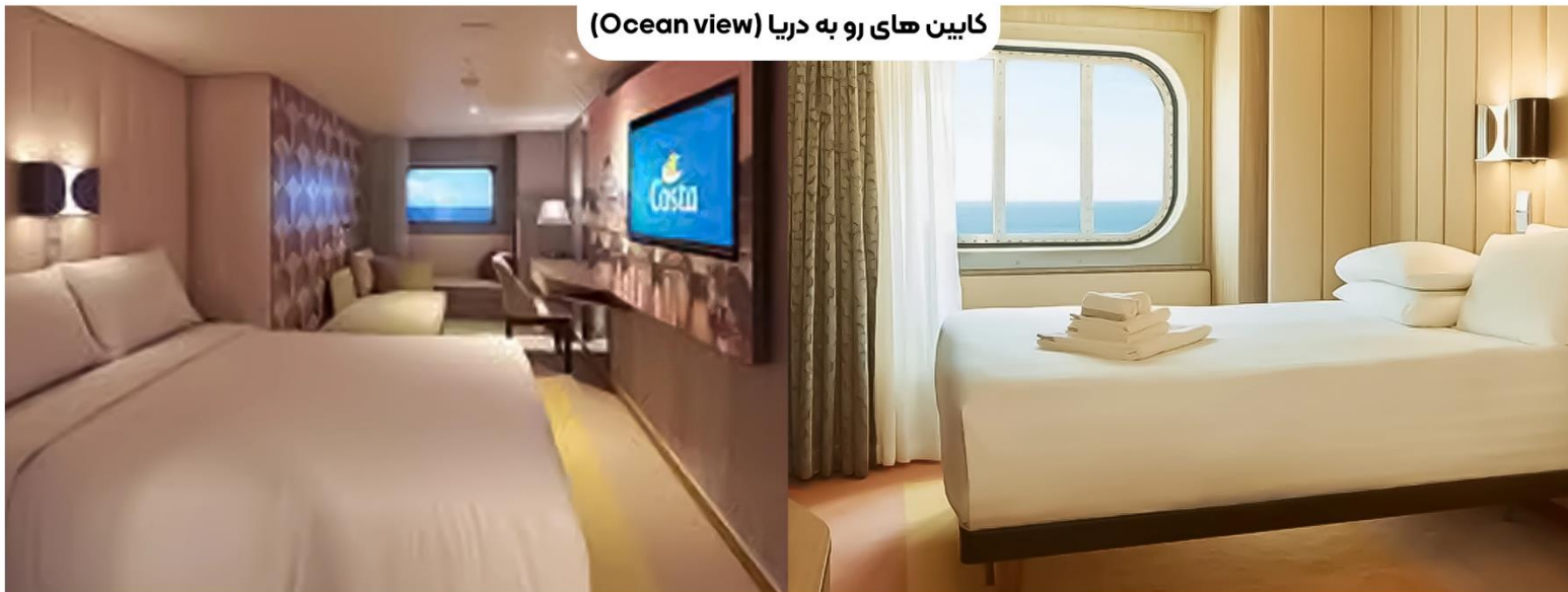
کابین‌های رو به دریا (Ocean view)

در طبقات ۴، ۵، ۹ تا ۱۷، حمام خصوصی دارای دوش، تا ۴ تخت، یک تخت دو نفره (یا ۲ تخت تک نفره). یک تخت‌کاناپه تک نفره و یک تخت جمع‌شو برای مهمانان سوم و چهارم، پنجره قابل باز کردن نیست. کولر گازی، تلویزیون ۴۰ اینچ، سشوار، تلفن، اتصال Wi-Fi (هزینه‌ها اعمال می‌شود)، لوازم بهداشتی.