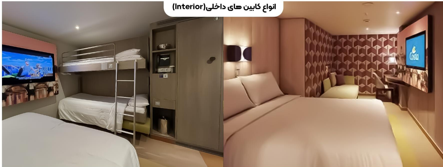
انواع کابین‌های داخلی (Interior)

در طبقات ۴ تا ۱۷، با حمام خصوصی، تا ۴ تخت، یک تخت دو نفره (یا ۲ تخت تک نفره). دو تخت جمع‌شو برای مهمانان سوم و چهارم در دسترس است، کولر گازی، تلویزیون ۴۰ اینچ، سشوار، تلفن، اتصال Wi-Fi (هزینه‌ها اعمال می‌شود)، لوازم بهداشتی، پتو و حوله‌های مورد نیاز برای اقامت (شیت‌ها و حوله‌ها)، حوله‌ی استخر