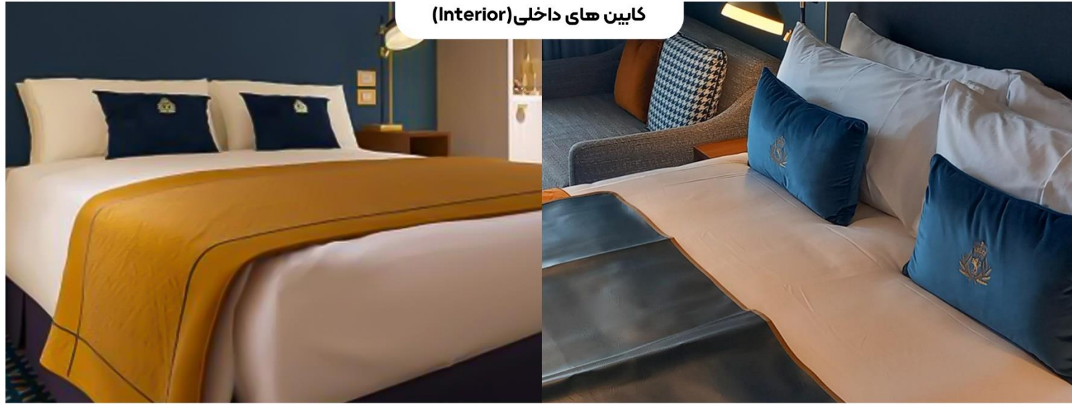
کابین های داخلی (Interior)