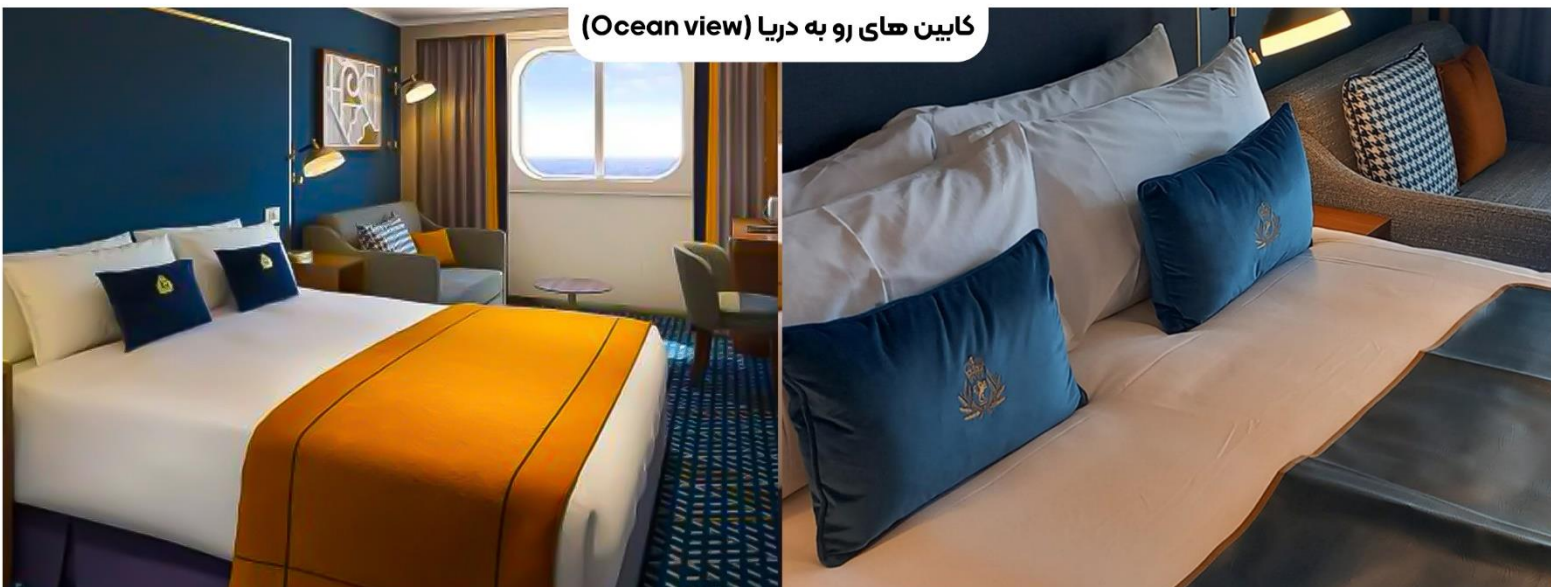
کابین های رو به دریا (Ocean view)

کابین Britannia Inside اتاقی که در آن احساس راحتی و سبکی را در طول سفر تجربه می‌کنید.