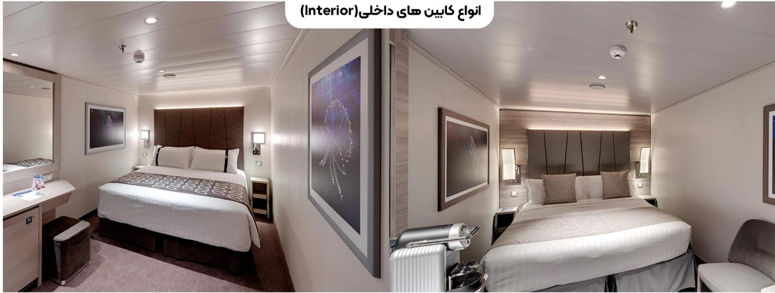
انواع کابین های داخلی (Interior)

اندازه کابین: تقریباً ۱۷ متر مربع حداکثر ظرفیت: ۴ نفر طبقات: ۸۵ تا ۱۳ تخت: دو تخت (در صورت درخواست می توان آنها را کنار هم قرار داد یا از هم جدا کرد)، برخی با دو تخت پولمن، تجهیزات کابین: گاوصندوق، تهویه مطبوع، سشوار، تلفن، تلویزیون، مینی بار، وای فای (ممکن است با توجه به سفر، هزینه پرداخت شود)