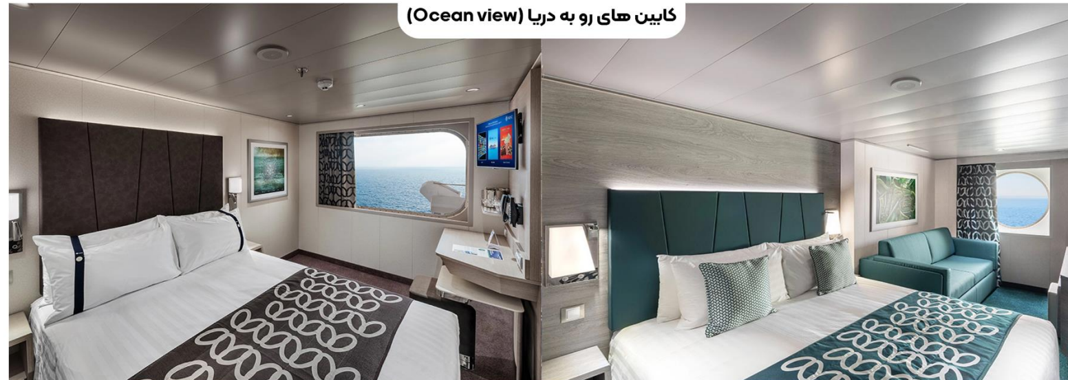
کابین های رو به دریا (Ocean view)

اندازه کابین: تقریباً ۱۲ متر تا ۲۵ متر مربع حداکثر ظرفیت: ۲ تا ۶ نفر طبقات: ۸۵ تا ۱۱ تخت: دو تخت (در صورت درخواست می توان آنها را کنار هم قرار داد یا از هم جدا کرد)، تجهیزات پایه کابین: گاوصندوق، تهویه مطبوع، سشوار، تلفن، تلویزیون، مینی بار، وای فای