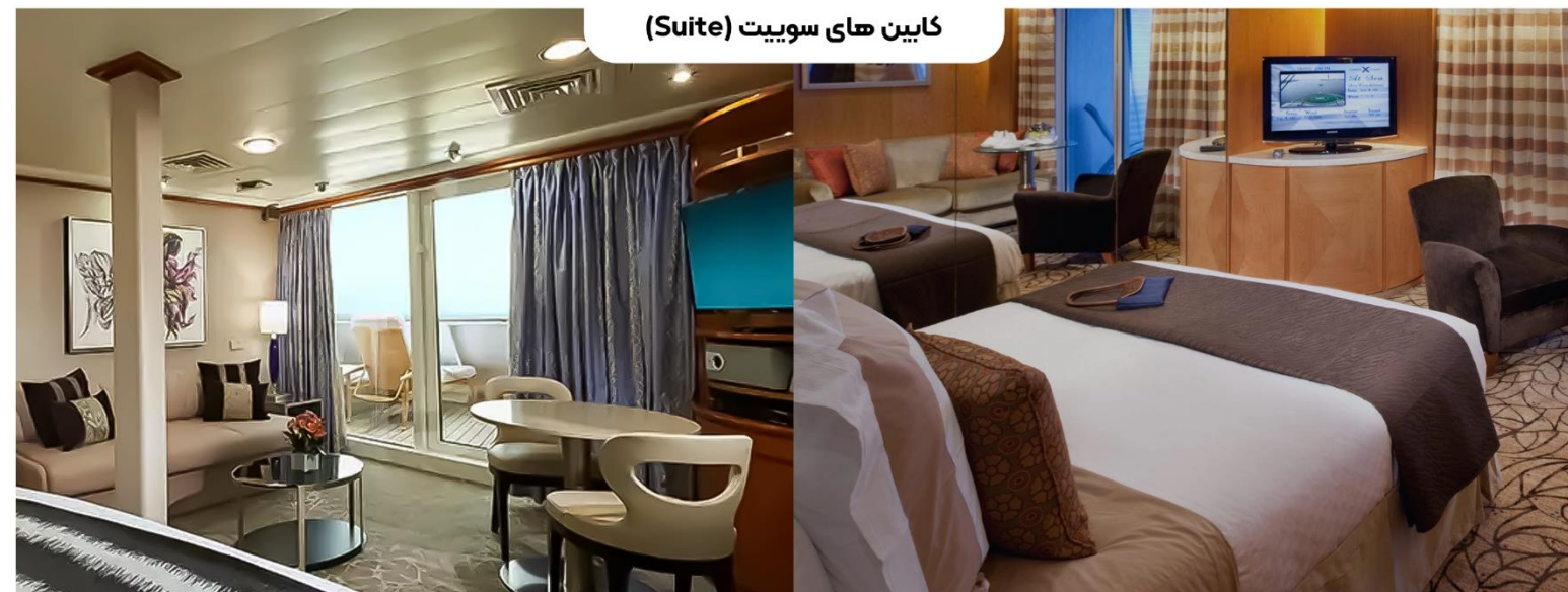
کابین های سویت (Suite)

اندازه کابین: تقریباً ۲۶ متر مربع تا ۶۰۰ متر مربع بالکن: تقریباً ۵ متر تا ۴۰۰ متر مربع با یک میز، دو صندلی طبقات: ۸ تا ۱۰ سوئیت‌های بالکن حداکثر تا ۷ مهمان ظرفیت دارند که در حالت پایه دو تخت دارند که به یک تخت کوئین تبدیل می‌شود، همچنین یک قسمت نشیمن، حمام لوکس با دوش و چشم‌انداز شگفت‌انگیز از بالکن خصوصی.