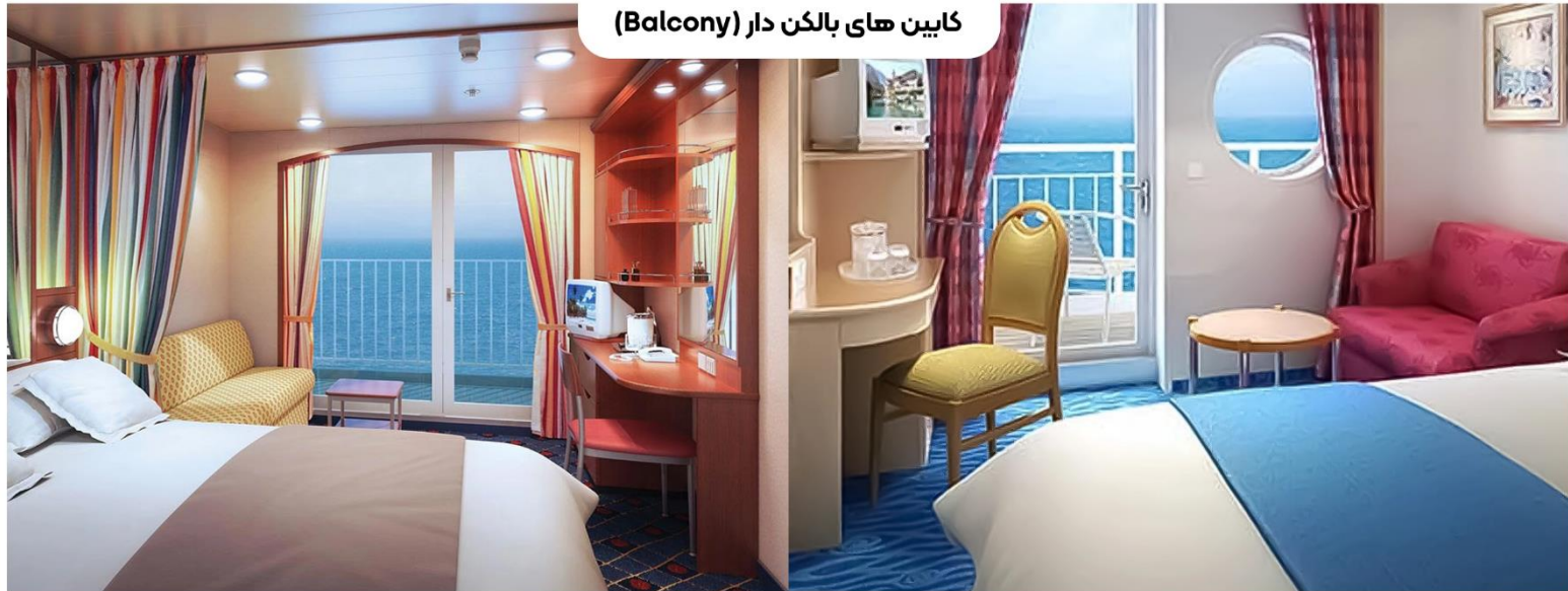
کابین های بالکن دار (Balcony)

اندازه کابین: تقریباً ۱۸ متر تا ۲۸ متر مربع بسته به نوع کابین بالکن: تقریباً ۴ متر مربع طبقات: ۹ و ۱۰ با گنجایش حداکثر سه مهمان، دو تخت دارند که به یک تخت کوئین تبدیل می‌شود و برخی از کابین‌ها تخت‌خواب‌های اضافی برای جای دادن یک تخت دیگر نیز دارند. همراه با فضای نشیمن، درهای شیشه‌ای از کف تا سقف و بالکن اختصاصی با منظره شگفت‌انگیز. برخی می‌توانند برای راحتی بیشتر متصل شوند.