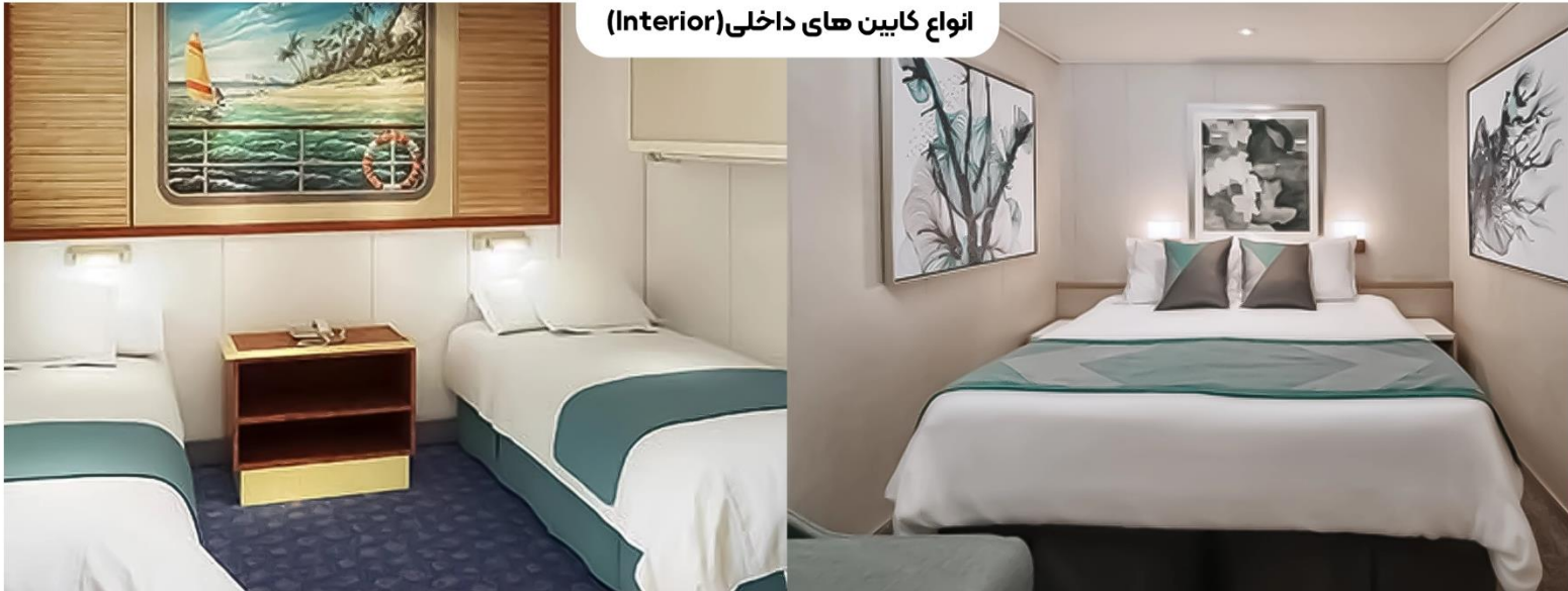
انواع کابین‌های داخلی (Interior)

اندازه کابین: تقریباً ۱۱ تا ۱۳ متر مربع حداکثر ظرفیت: ۴ نفر طبقات: ۴ تا ۱۰ مقرون به صرفه‌ترین کابین این کشتی است. یک تخت کوئین سایز و تخت خواب اضافی برای پذیرایی از دو مهمان در کابین قرار گرفته است. علاوه بر این انواع امکانات رفاهی نیز مانند سرویس اتاق و موارد دیگر در دسترس خواهد بود.