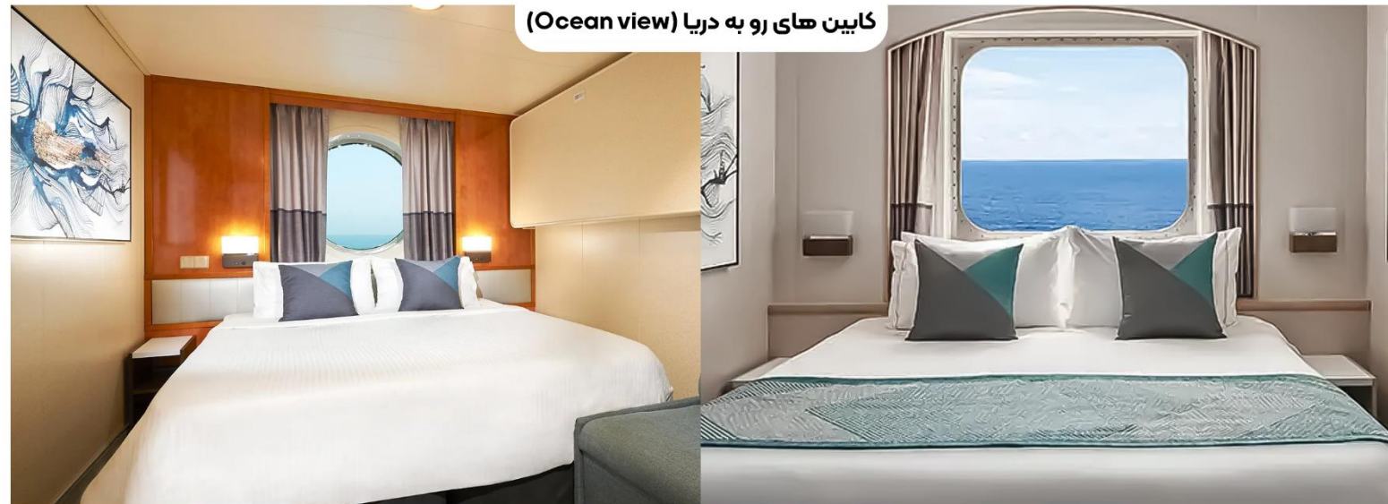
کابین‌های رو به دریا (Ocean view)

اندازه کابین: تقریباً ۱۳ متر مربع حداکثر ظرفیت: ۴ نفر طبقات: ۴ تا ۱۰ مقرون به صرفه‌ترین اتاق این کشتی است. یک تخت کوئین سایز و تخت خواب اضافی برای پذیرایی از دو مهمان در کابین قرار گرفته است. و همچنین یک پنجره بزرگ با تصویری بزرگ که منظره‌ای عالی را ارائه می‌دهد. به علاوه برخی می‌توانند برای فضای بیشتر به هم متصل شوند.